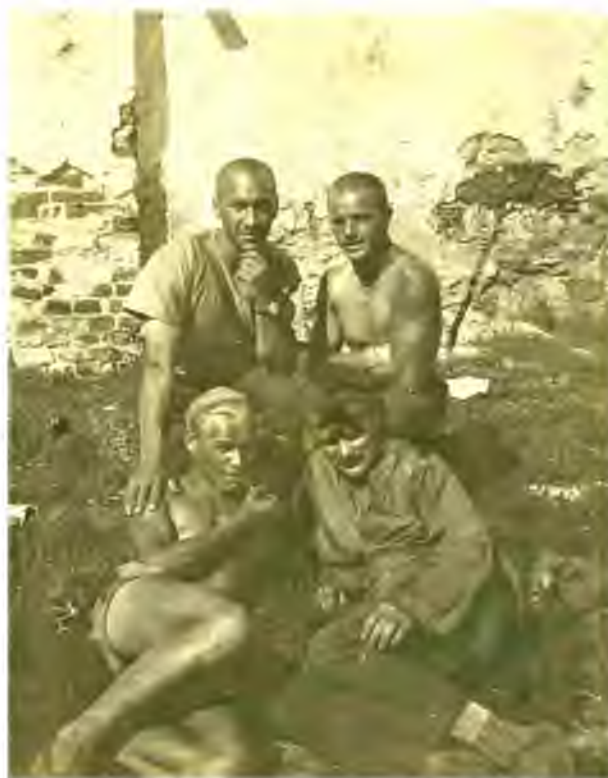
Рис. 2. Участники Новгородской археологической экспедиции: Б. А. Рыбаков, И. В. Щербаков, А. Н. Рогачев, А. В. Арциховский. Новгород, 1932 г. НГМ КП-40227/1092

пятна застройки. Через три недели после начала исследований ГАИМК направила М. К. Каргера в Новгород. По результатам изучения раскопок и отчетных материалов М. К. Каргер в конце октября отметил: «Нет сомнения, что раскопки представляют значительный интерес для ГАИМК. Перед нами уголок феодального города с постройками как жилого, так, по-видимому, и хозяйственного назначения» (ОПИ НМЗ. Ф. Р-12. Оп. 1. Ед. хр. 69. Л. 1). В этой связи между ГАИМК и Новгородским музеем (НМ) наметилась линия на дальнейшее сотрудничество. Производство в Новгороде археологических наблюдений, а также раскопок силами Новгородского музея должно было стать важным дополнением к исследованиям А. В. Арциховского.