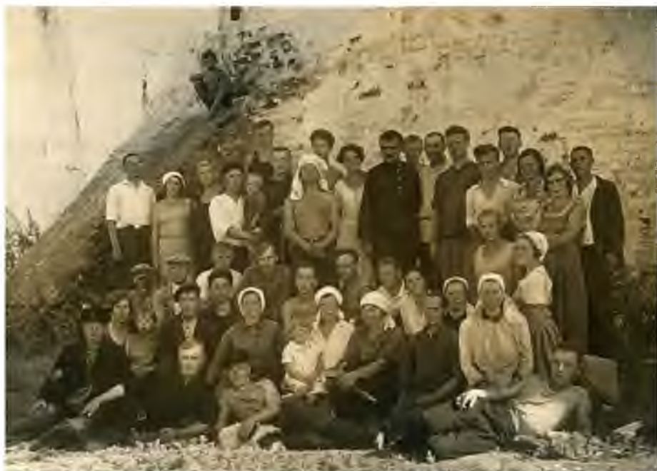
Рис. 3. Участники Новгородской археологической экспедиции. Новгород, 1937 г.